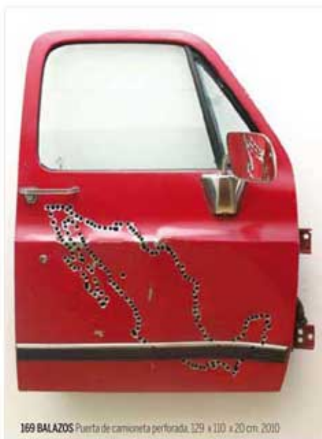
169 BALAZOS Puerta de camioneta perforada. 129 x 110 x 20 cm. 2010

La simplicidad en el trabajo de Birks es lo que ayuda a su mensaje. Ya se trate de ironía social o divagaciones metafísicas el trabajo final es transparente, como en "No tengo nada que ocultar", una serie de maletas de acrílico transparente, un lugar común en el aeropuerto. Con las palabras "No tengo nada que ocultar" pegado en el interior, claramente legible desde el exterior y traducido a siete idiomas diferentes, Davis explica: "Millones de personas pasan por los aeropuertos todos los días con la sola idea de ir de un lugar a otro sin ninguna intención de crear tumulto. Sin embargo, hay un pequeño porcentaje de gente que utilizará todos los medios a su disposición para que este miedo proliferé a través del uso de la violencia; un aspecto que simplemente ha sido siempre una parte de la vida que se manifiesta de manera diferente con cada generación. Me gusta la idea de la maleta transparente, ya que se relaciona bien con nuestra obsesión por crear un mundo transparente, sin rincones oscuros por el uso de la vigilancia y los rayos X".