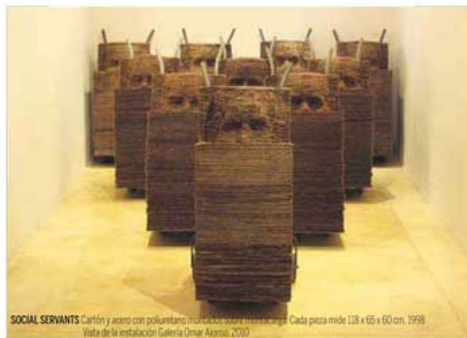
SOCIAL SERVANTS Cartón y acero con poliestireno incoloro sobre montaje. Cada pieza mide 128 x 65 x 60 cm, 1998 Vista de la instalación Galería Omar Alonso, 2010

At present, Davis' work in Puerto Vallarta continues to explore outside of the usual art encountered in a tourist city. Other artists have joined him in this pursuit of art with social content. The explosion of Internet access, and a wider international creative community, has made contemporary art move beyond the borders of Mexico City.