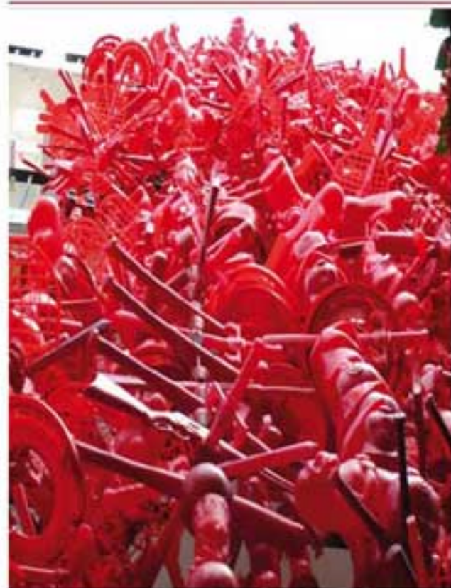
LA RED Juguetes de plástico con cable. 10 x 7 m. 2011

El plástico, nuestro ubicuo producto cultural disponible, es otra de sus fascinaciones