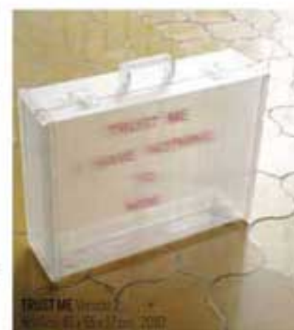
TRUST ME Acrylic, 15 x 15 x 10 cm, 2002

from one place to the other and have no intention of creating mayhem. Nevertheless, there is a small percentage of those who use whatever means at their disposal to proliferate this fear through the use of violence, an aspect that has simply always been a part of life, manifesting in itself in different ways with each generation. I like the idea of the translucent suitcase because it correlates well with our obsession of creating a transparent world with no dark corners through the use of surveillance and x-rays."