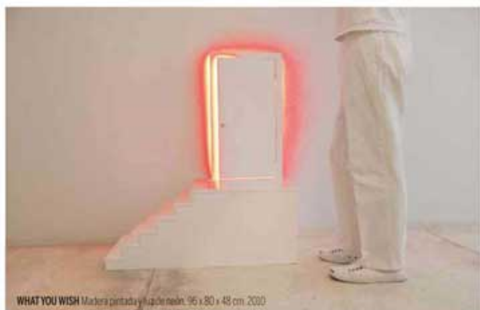
WHAT YOU WISH Madera pintada y luz neón. 96 x 80 x 48 cm. 2010

La muestra de arte contemporáneo "Red / Rojo" en la Galería Omar Alonso en Puerto Vallarta, recientemente mostró una de las enormes instalaciones de plástico de Davis.