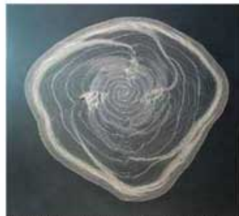
CARVED SPIRAL no.15 Grabado en hoja de acrílico. 180 x 180 cm. 2008

La Galería Omar Alonso en Puerto Vallarta presentará, "Red / Rojo", una muestra contemporánea de artistas de América Latina, Europa, Canadá y los Estados Unidos. El programa incluirá un buen número de obras recientes de Davis Birks. La muestra se abre el 18 de febrero con pinturas, esculturas, videos, instalaciones y performance de más de 20 artistas.